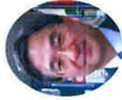
水島 朝穂 (みずしま あさほ)

NPO法人ピースデポ特別顧問。磁性物理学を専攻し東京大学数物系大学院博士課程修了。工学博士。大学教員などを経て1980年よりフリーに。以後、さまざまな平和、軍縮、人権問題に取り組み。核兵器廃絶を目指す国際NGO中堅国家構想(MP)国際運営委員。核軍縮・不拡散議員連盟(PNND)東アジアコーディネーター。